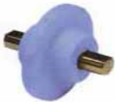
Ein - Steg - Laufrolle