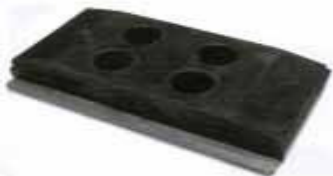
Vögele Bodenplatte in Gummi und PU