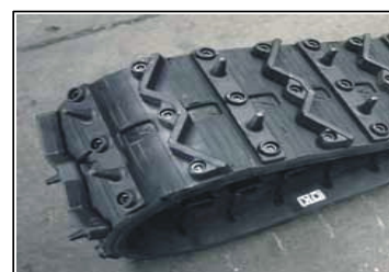
"Steigeisenketten" mit Profileisen