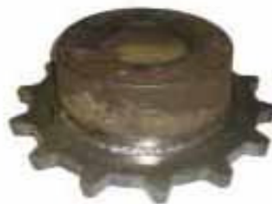
Reparatur aus unserer Werkstatt